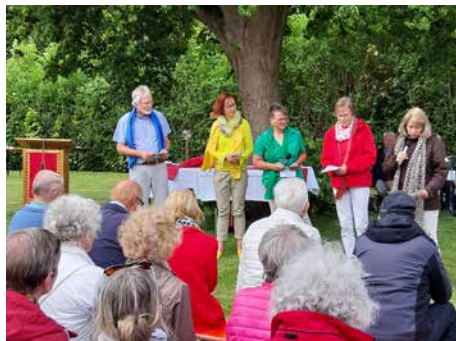
Bunt war die Auswahl der Musik, bunt war auch das Thema eines kleinen Anspiels. 3