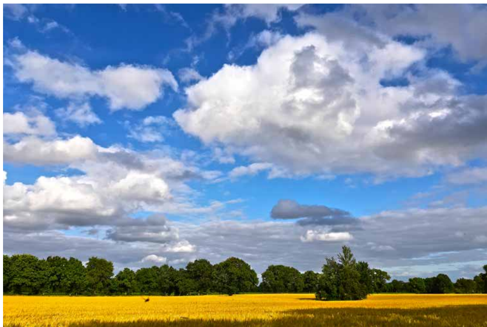
Wallheckenlandschaft in Ihlow

EVANG.-FREIKIRCHLICHE GEMEINDE NORDEN CHRISTUSKIRCHE OSTERSTRASSE 139 INFORMATIONEN FÜR August/September 2019